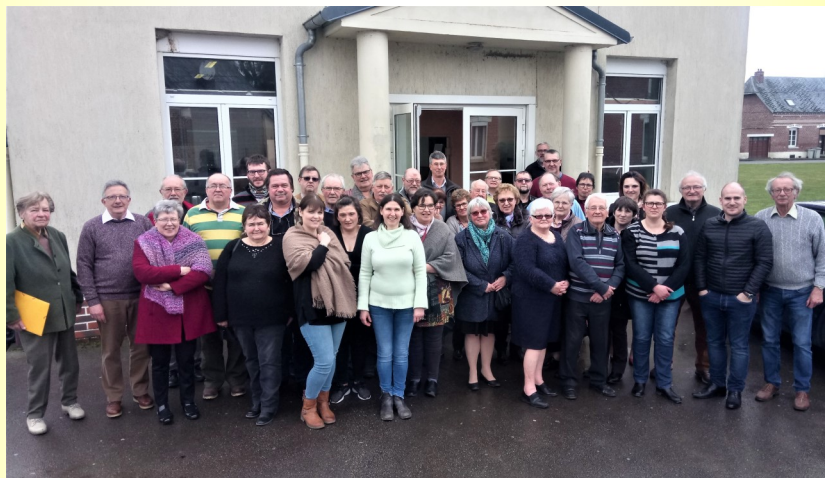
AG de la FD—Doingt mars 2018

Le report de cette commémoration en 2022 est certainement à envisager dès maintenant